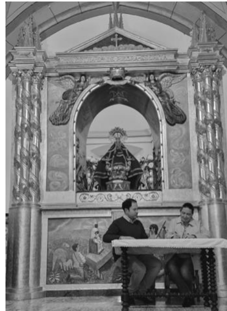
Firma de la solicitud, el 1 de enero de 2023, por la Mayordomía de la Hermandad y el Presidente del Fondo Cultural Valeria.

conserva en la Ermita de Piedraescrita y bajo la cual -según la tradición conocida por todos nosotros- apareció la imagen de la Virgen; de aquí procede el nombre de nuestra Patrona, pues fue hallada junto a una lápida con inscripciones en latín, lo que originó que se anunciara el hallazgo de la Virgen al lado de una «piedra escrita».