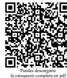
Puedes descargar la catequesis completa en pdf

La Liturgia eucarística se concluye con la oración después de la comunión. El sacerdote se dirige a Dios para darle las gracias por habernos hecho sus comensales y pedir que lo que hemos recibido transforme nuestra vida. La eucaristía nos hace fuertes para dar frutos de buenas obras para vivir como cristianos.