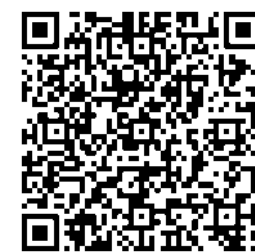
Puedes descargar la catequesis completa en pdf

Y la oración debemos hacerla con este espíritu de fe.