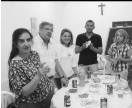
Algunos alumnos en aperitivo de fin de curso